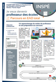
Contenu de la formation