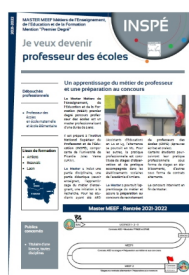
Contenu de la formation