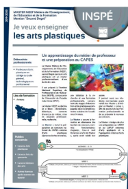
Contenu de la formation