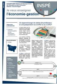
Contenu de la formation

Communication organisation et gestion des ressources humaines