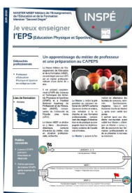
Contenu de la formation

Cette équipe stable, dynamique et complémentaire permet de participer avec la plus grande "exigence bienveillante" à la formation aux CAPEPS et à l'acquisition des compétences professionnelles inhérentes aux métiers de l'enseignement.