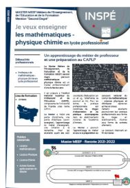
Contenu de la formation

L'équipe pédagogique est constituée d'enseignants à l'université (PRAG, MCF, PU), d'enseignants de terrain (professeurs en lycée professionnel) et de formateurs académiques (FA, IEN).