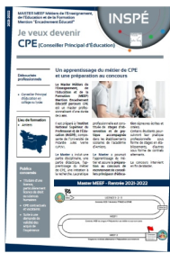
Contenu de la formation