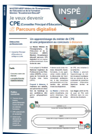
Contenu de la formation

L'ouverture de places pour des personnes ne provenant pas du M1 CPE digitalisé dépend du nombre d'étudiants montants issus du M1. Nous ne pouvons pas garantir à l'avance que des places seront libérées, car tout dépendra des places vacantes une fois les M1 passés en M2 (selon les redoublements, abandons, réussites au concours interne ou externe, changements de projets, etc...).